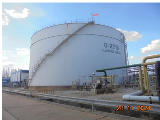
ภาพที่ 3-18 Clarified Water Tank (Q-2216)