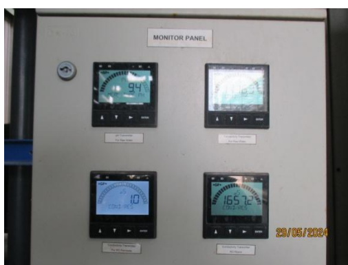
ภาพที่ 3-15 Conductivity Online บริเวณระบบ Reverse Osmosis