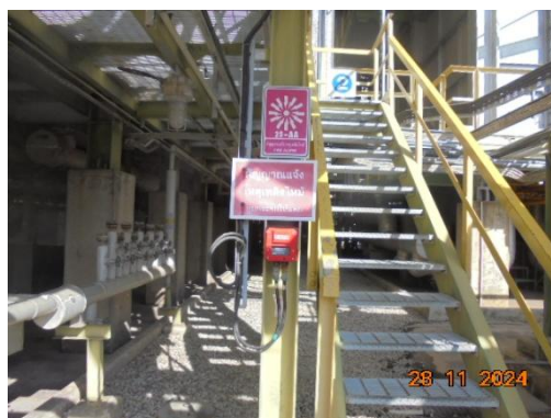
สัญญาณแจ้งเหตุอัคคีภัย