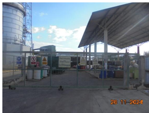
ภาพที่ 3-27 อาคารเก็บกากของเสีย