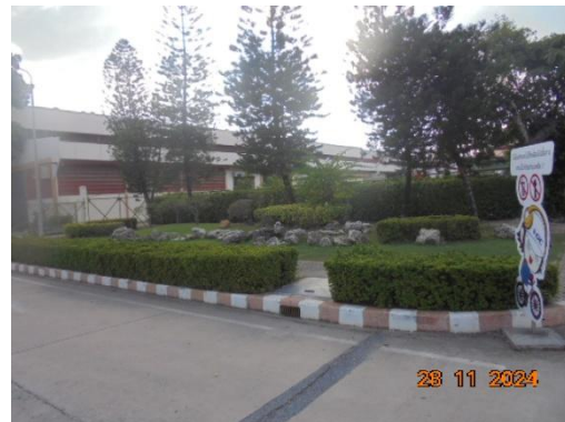
ภาพที่ 3-55 พื้นที่สีเขียว

รูปที่ 3 ภาพถ่ายประกอบผลการปฏิบัติตามมาตรการป้องกันและแก้ไข ผลกระทบสิ่งแวดล้อม โครงการโรงผลิตสารโอลิฟินส์ บริษัท พีทีที โกลบอล เคมิคอล จำกัด (มหาชน) โรงโอลิฟินส์ 2