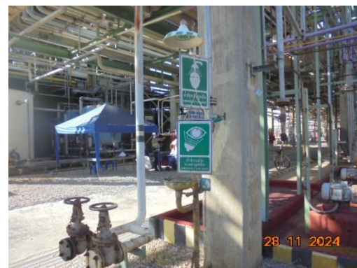
ภาพที่ 3-42 ฝักบัวฉุกเฉิน และที่ล้างตา

รูปที่ 3 ภาพถ่ายประกอบผลการปฏิบัติตามมาตรการป้องกันและแก้ไข ผลกระทบสิ่งแวดล้อม โครงการโรงผลิตสารโอลิฟินส์ บริษัท พีทีที โกลบอล เคมิคอล จำกัด (มหาชน) โรงโอลิฟินส์ 2