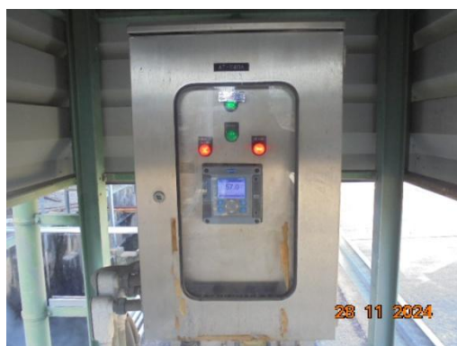
ภาพที่ 3-13 ระบบ Online จุดก่อนปล่อยน้ำออกนอกโครงการ