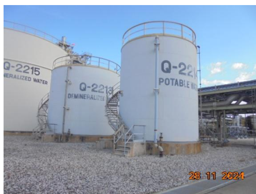
ภาพที่ 3-20 Portable Water Tank (Q-2214)

รูปที่ 3 ภาพถ่ายประกอบผลการปฏิบัติตามมาตรการป้องกันและแก้ไข ผลกระทบสิ่งแวดล้อม โครงการโรงผลิตสารโอลิฟินส์ บริษัท พีทีที โกลบอล เคมิคอล จำกัด (มหาชน) โรงโอลิฟินส์ 2