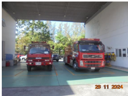
รถดับเพลิง