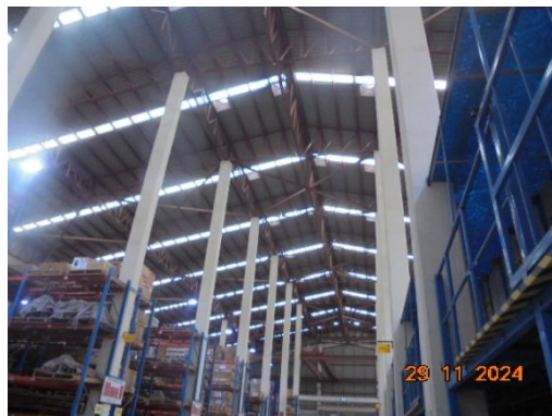
ภาพที่ 3-34 การระบายอากาศและแสงสว่าง