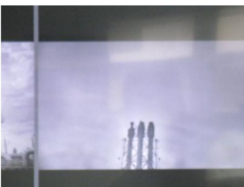
ภาพที่ 3-4 CCTV เพื่อตรวจสอบระบบ Flare