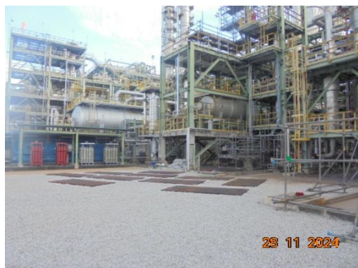
ภาพที่ 3-11 Surge Drum