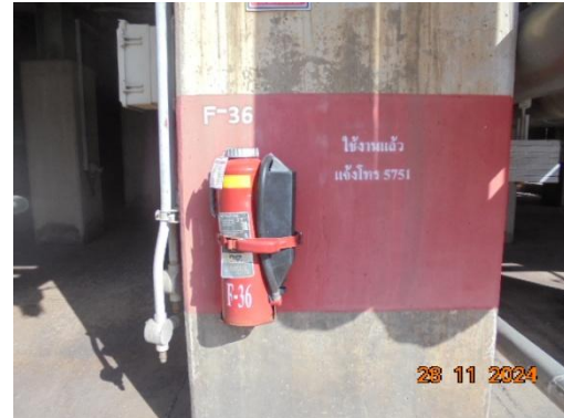
ถังดับเพลิง