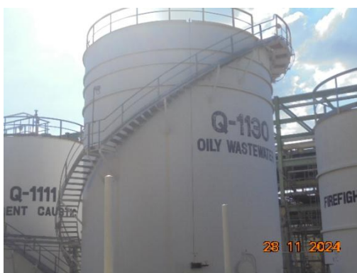
ภาพที่ 3-10 Oily Wastewater Holding Tank (Q-1130)

รูปที่ 3 ภาพถ่ายประกอบผลการปฏิบัติตามมาตรการป้องกันและแก้ไข ผลกระทบสิ่งแวดล้อม โครงการโรงผลิตสารโอลิฟินส์ บริษัท พีทีที โกลบอล เคมิคอล จำกัด (มหาชน) โรงโอลิฟินส์ 2