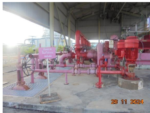
ภาพที่ 3-48 แหล่งน้ำสำรองดับเพลิง และเครื่องสูบน้ำดับเพลิง (ต่อ)