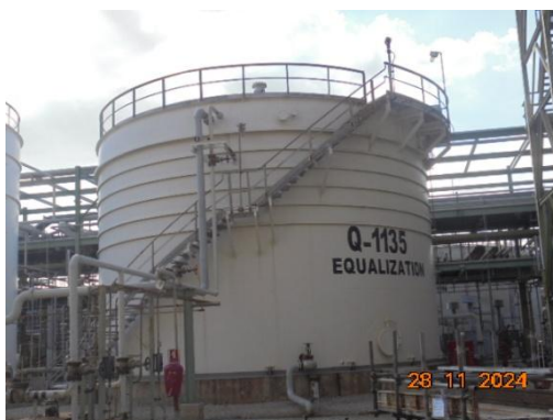
ภาพที่ 3-8 Equalization (Q-1135)