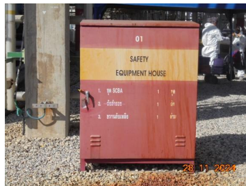
ภาพที่ 3-43 ระบบดับเพลิงต่างๆ (ต่อ)