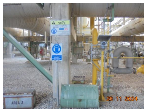
ภาพที่ 3-37 ป้ายเตือนสวมใส่อุปกรณ์ป้องกันเสียง

รูปที่ 3 ภาพถ่ายประกอบผลการปฏิบัติตามมาตรการป้องกันและแก้ไข ผลกระทบสิ่งแวดล้อม โครงการโรงผลิตสารโอลิฟินส์ บริษัท พีทีที โกลบอล เคมิคอล จำกัด (มหาชน) โรงโอลิฟินส์ 2