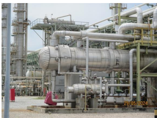
ภาพที่ 3-49 อุปกรณ์ป้องกันอันตราย จากหม้อต้มไอน้ำ