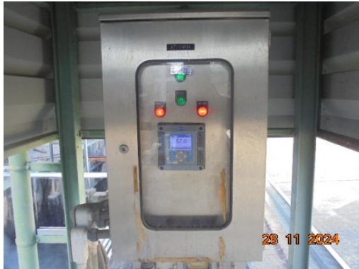
ภาพที่ 3-53 COD Online ที่ Final Check Basin