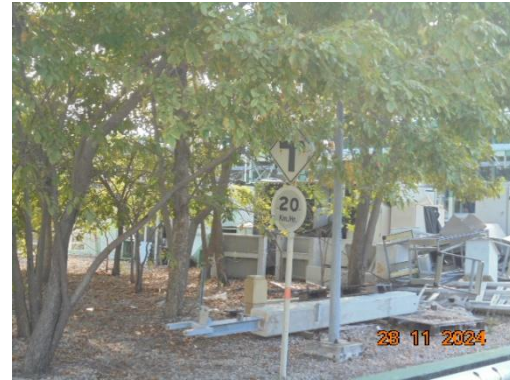
ภาพที่ 3-21 ป้ายสัญญาณจราจร