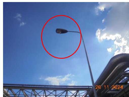
ภาพที่ 3-40 ระบบส่องสว่างภายในพื้นที่โครงการ