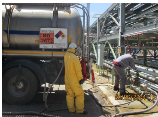
ภาพที่ 3-30 พนักงานที่ปฏิบัติงานเกี่ยวกับสารเคมีและกากของเสียสวมใส่อุปกรณ์ PPE ที่เหมาะสม