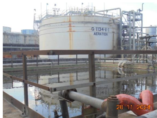
ภาพที่ 3-12 Final Check Basin (Q-1139)