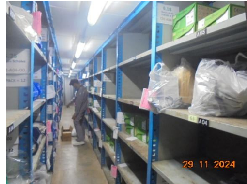
ภาพที่ 3-38 การจัดเตรียมอุปกรณ์ PPE ให้กับพนักงาน