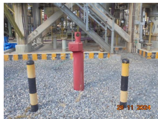
ภาพที่ 3-43 ระบบดับเพลิงต่างๆ

รูปที่ 3 ภาพถ่ายประกอบผลการปฏิบัติตามมาตรการป้องกันและแก้ไข ผลกระทบสิ่งแวดล้อม โครงการโรงผลิตสารโอลิฟินส์ บริษัท พีทีที โกลบอล เคมิคอล จำกัด (มหาชน) โรงโอลิฟินส์ 2