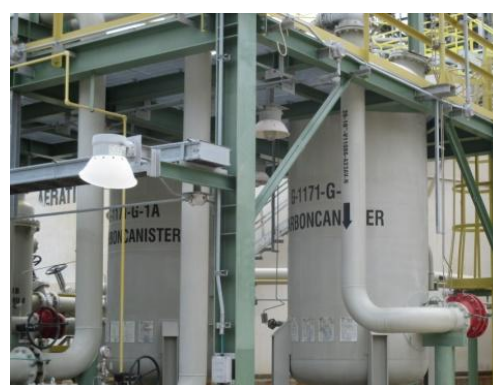
ภาพที่ 3-52 ระบบ Activated Carbon Canister

รูปที่ 3 ภาพถ่ายประกอบผลการปฏิบัติตามมาตรการป้องกันและแก้ไข ผลกระทบสิ่งแวดล้อม โครงการโรงผลิตสารโอลิฟินส์ บริษัท พีทีที โกลบอล เคมิคอล จำกัด (มหาชน) โรงโอลิฟินส์ 2