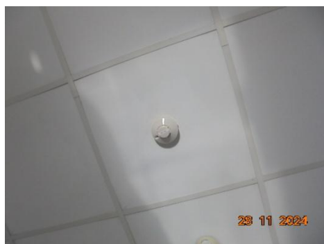
ระบบตรวจจับควัน