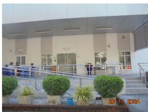
ภาพที่ 3-51 สถานพยาบาล