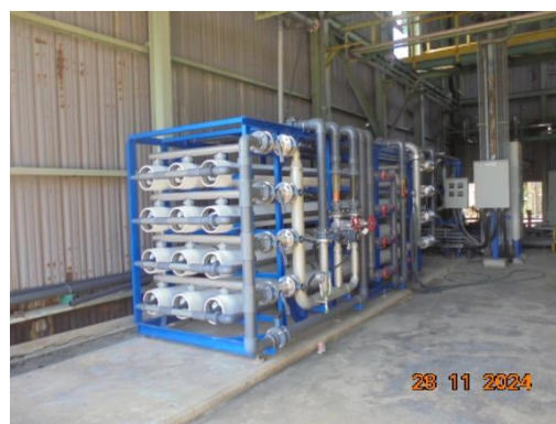
ภาพที่ 3-14 ระบบ Reverse Osmosis (RO)