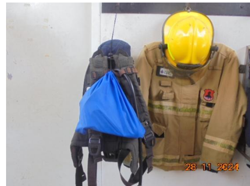
เครื่องช่วยหายใจ