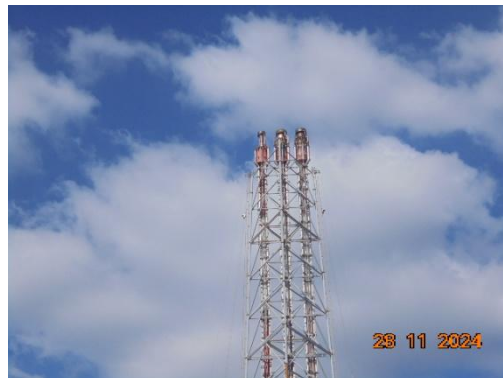
ภาพที่ 3-2 ระบบ Flare