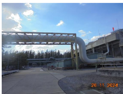
ภาพที่ 3-16 Emergency Basin (Q-1155)

รูปที่ 3 ภาพถ่ายประกอบผลการปฏิบัติตามมาตรการป้องกันและแก้ไข ผลกระทบสิ่งแวดล้อม โครงการโรงผลิตสารโอลิฟินส์ บริษัท พีทีที โกลบอล เคมิคอล จำกัด (มหาชน) โรงโอลิฟินส์ 2