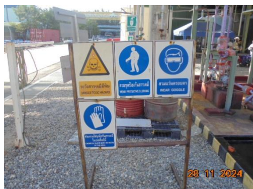
ภาพที่ 3-31 ป้ายเตือนให้สวมใส่อุปกรณ์คุ้มครองความปลอดภัยส่วนบุคคล

รูปที่ 3 ภาพถ่ายประกอบผลการปฏิบัติตามมาตรการป้องกันและแก้ไขผลกระทบสิ่งแวดล้อม โครงการโรงผลิตสารโอลิฟินส์ บริษัท พีทีที โกลบอล เคมิคอล จำกัด (มหาชน) โรงโอลิฟินส์ 2