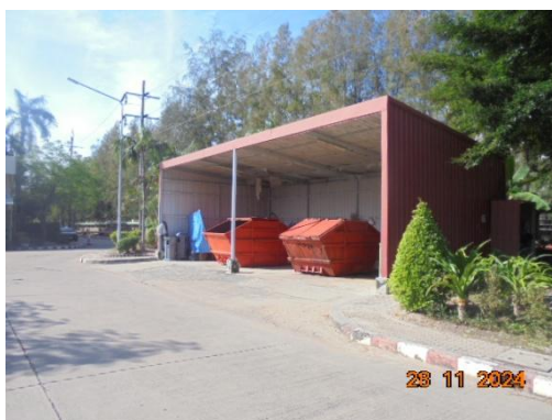
ภาพที่ 3-28 ถังรองรับขยะจากอาคารสำนักงาน