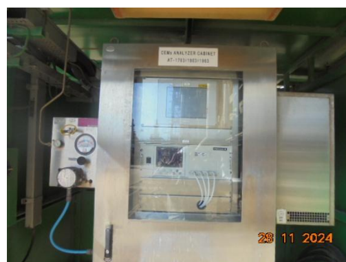
ภาพที่ 3-5 อุปกรณ์ตรวจวัดมลพิษอัตโนมัติแบบต่อเนื่อง (CEMS)

รูปที่ 3 ภาพถ่ายประกอบผลการปฏิบัติตามมาตรการป้องกันและแก้ไข ผลกระทบสิ่งแวดล้อม โครงการโรงผลิตสารโอลิฟินส์ บริษัท พีทีที โกลบอล เคมิคอล จำกัด (มหาชน) โรงโอลิฟินส์ 2