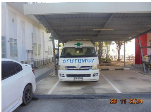
ภาพที่ 3-46 รถพยาบาล