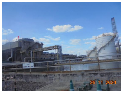
ภาพที่ 3-6 ระบบบำบัดน้ำเสีย