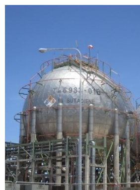
ภาพที่ 3-50 ถังเก็บก๊าซ 1,3-บิวทาไดอิน บริเวณท่าเทียบเรือ และคลังผลิตภัณฑ์