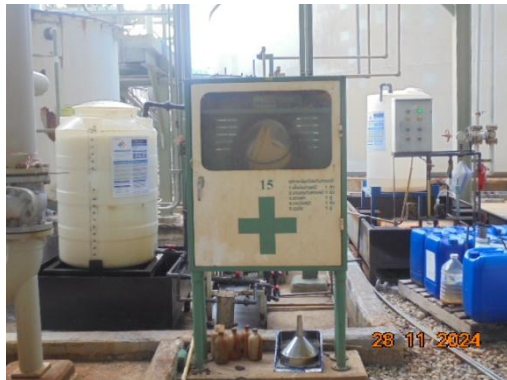
ภาพที่ 3-32 ตู้จัดเก็บชุดกันสารเคมี