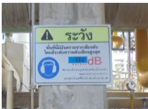
ภาพที่ 3-36 ป้ายเตือนบริเวณที่มีเสียงดัง