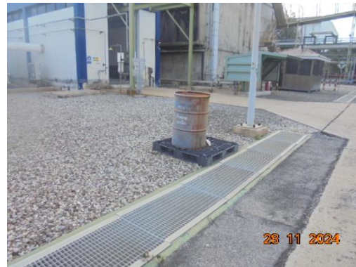
ภาพที่ 3-33 วัสดุดูดซับ