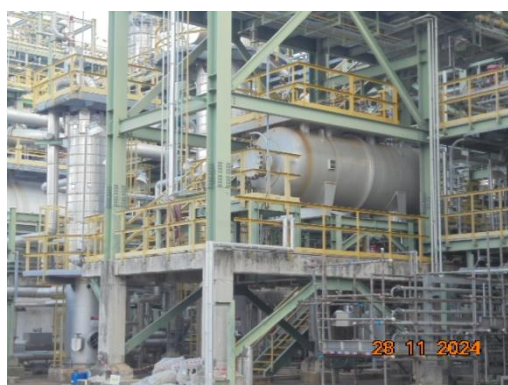
ภาพที่ 3-9 Wastewater Stripper