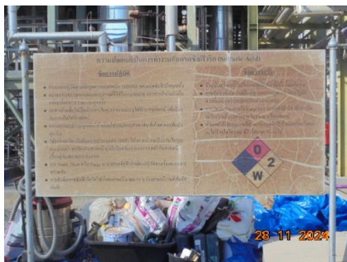
ภาพที่ 3-39 ป้าย SDS บริเวณที่มีการใช้สารเคมี ของโครงการ