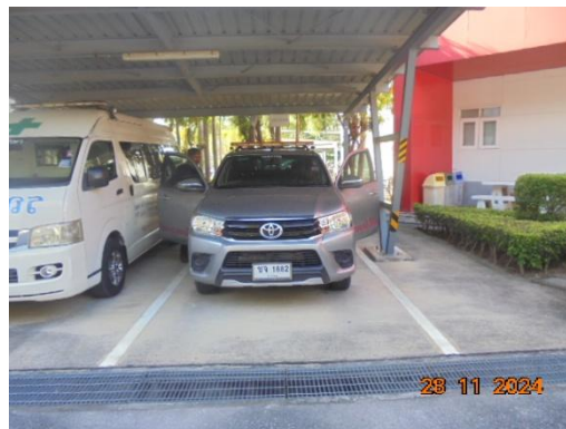
ภาพที่ 3-47 รถตรวจการณ์