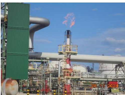
ภาพที่ 3-3 ระบบ Low Pressure Flare