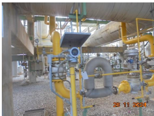
ภาพที่ 3-41 Flammable Gas Detector