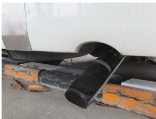
ภาพที่ 3-26 อุปกรณ์ป้องกันประกายไฟ