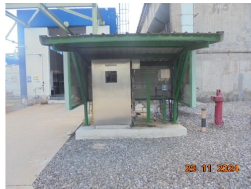
ภาพที่ 3-54 Conductivity Online ที่ Cooling Blowdown