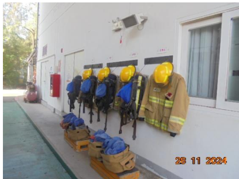
ชุดผจญเพลิง