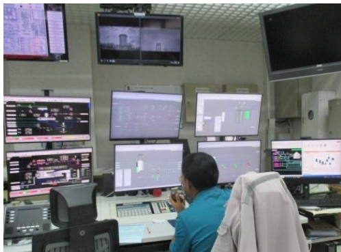
ภาพที่ 3-1 ระบบ DCS