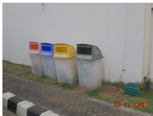
ภาพที่ 3-29 ถังขยะแยกประเภท