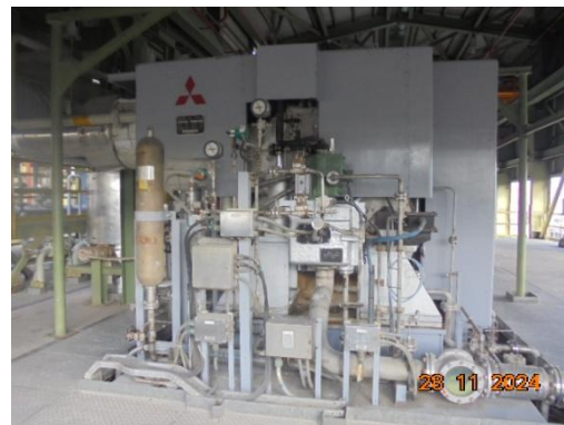
ภาพที่ 3-35 ห้องครอบเครื่องจักร