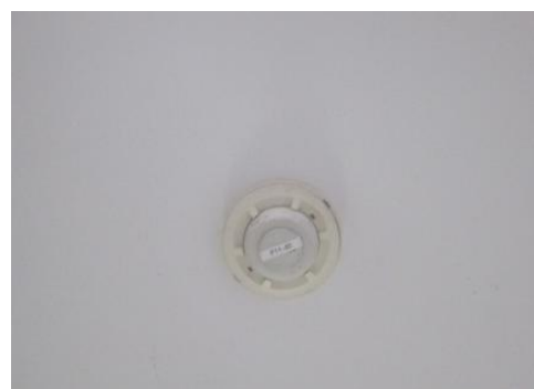
ระบบตรวจจับความร้อน