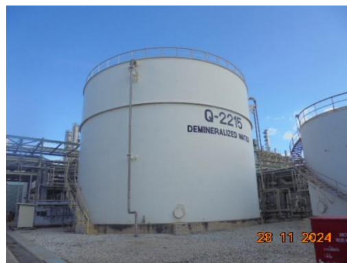
ภาพที่ 3-19 Demineralized Water Tank