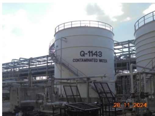
ภาพที่ 3-7 Contaminated Water Surge Tank (Q-1143)