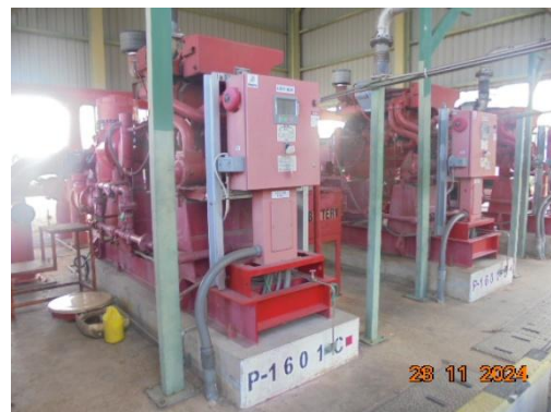
ภาพที่ 3-48 แหล่งน้ำสำรองดับเพลิง และเครื่องสูบน้ำดับเพลิง

รูปที่ 3 ภาพถ่ายประกอบผลการปฏิบัติตามมาตรการป้องกันและแก้ไข ผลกระทบสิ่งแวดล้อม โครงการโรงผลิตสารโอลิฟินส์ บริษัท พีทีที โกลบอล เคมิคอล จำกัด (มหาชน) โรงโอลิฟินส์ 2